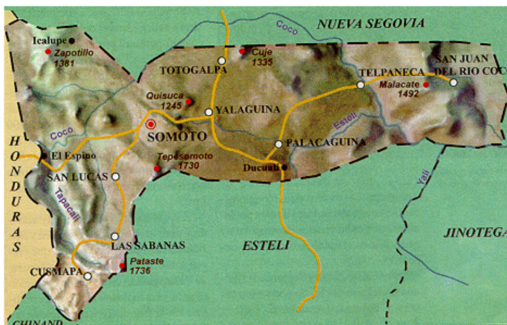
Figura 1. Ubicación geográfica del sitio experimental.

El experimento se realizó en la comunidad El Castillito, municipio de Las Sabanas, departamento de Madriz. Este departamento se encuentra ubicado en la región norte del país entre los 13° 26' 00" latitud norte y 86° 37' 01" longitud oeste. El municipio de Las Sabanas limita al norte con el municipio de San Lucas, al sur con San José de Cusmapa, al este con Estelí y al oeste con Honduras; presenta una temperatura anual promedio entre 26 y 27 °C, y una elevación media de 1260 msnm. La comunidad El Castillito presenta una temperatura anual entre 18 y 22 °C grados Celsius, El clima es subtropical seco con precipitaciones anuales entre 1,200 a 1,400 mm por año.